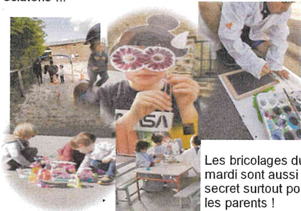
Les bricolages du mardi sont aussi top secret surtout pour les parents !

Nous sortons les tables, les jeux.. Et nous nous éclatons !!!